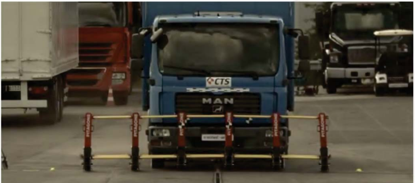
Test effectué sur un véhicule de 7,4 tonnes