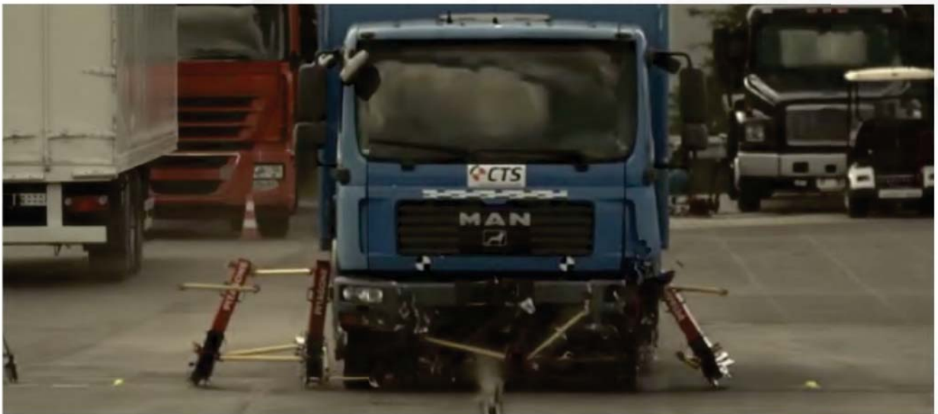
Impact du véhicule à 48,3 km/h