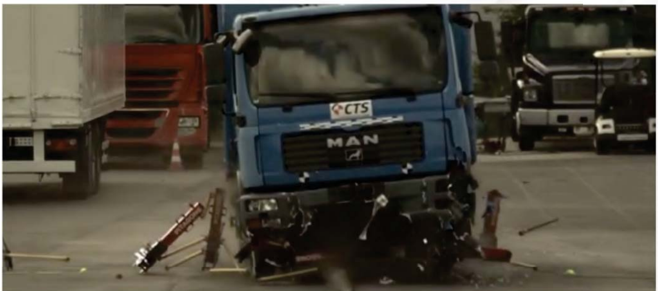
Arrêt du véhicule