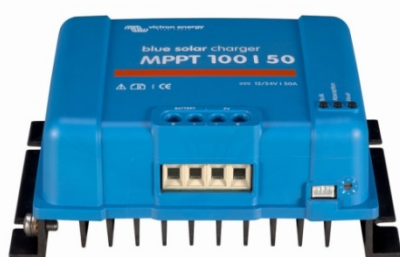
Contrôleur de charge solaire MPPT 100/50